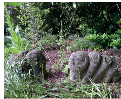
Im Garten von Cluny Hill (Schottland)