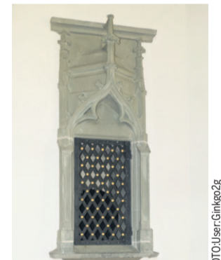
SAKRAMENTSHAUS IN DER KIRCHE MOOSSEEDORF