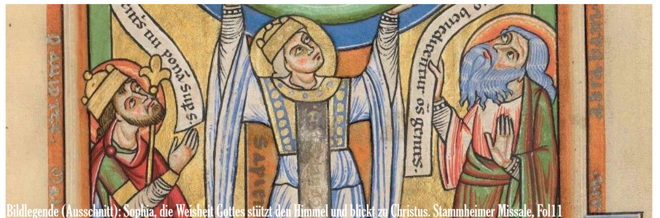
Bildlegende (Ausschnitt): Sophia, die Weisheit Gottes stützt den Himmel und blickt zu Christus. Stammheimer Missale, Fol. 11

Sonntag, 27. Dezember, 17:00 Uhr, Kirche Münchenbuchsee: Taizégottesdienst kige.ch oder Christian Hofer, 031 862 05 74)